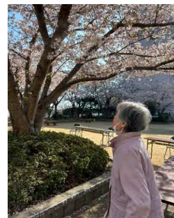
桜をうっとり見上げておられる姿が印象的です。