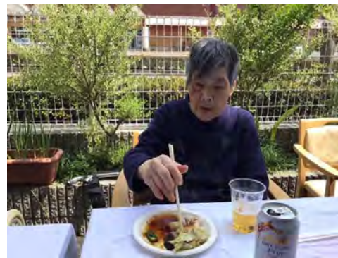
外で食べるとやっぱり美味しい！