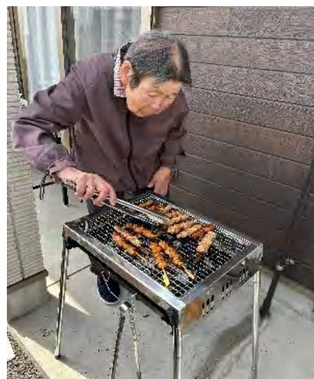
炭火焼鳥担当して下さいました。美味しかったですね！！