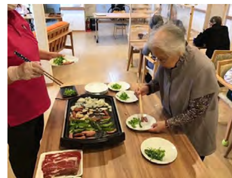
室内でも同時開催です！