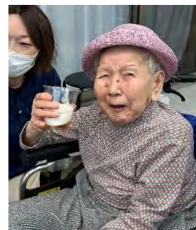
ノンアルビールで乾杯！