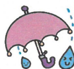
～マーブルクレヨン～不思議な実験製作遊び～