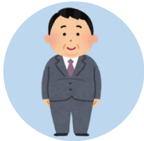
肥満の人、 普段運動していない人