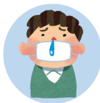
体調の悪い人、 赤ちゃんや幼児 持病のある人